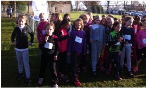
Les filles de CE2 au départ du cross de Messei

Par ailleurs, l'USEP (association sportive de l'école) comprend toujours autant d'adhérents : 79 sur les 143 élèves que compte l'école. Outre les séances du mardi et du jeudi soir, les élèves ont pu participer à une après-midi « initiation au monde du handicap » et à un cross près d'Alençon. Le cross de Messei qui a eu lieu le 22 novembre a rassemblé 910 élèves provenant de 9 écoles différentes.