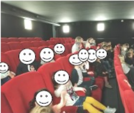
Une séance au cinéma.....