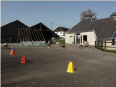
La matériel sportif pour faire de grands sportifs!! Nous avons la chance d'être très bien équipés...