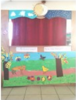
Un spectacle de marionnettes....