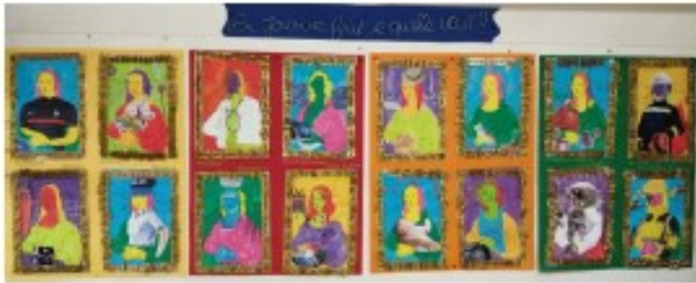
Le Musée: Visite, Ci-dessus , ce que nous avons fait l'an dernier (Par Facebook) et notre œuvre collective avec les 3 classes (Banquet de papier ) en 2019